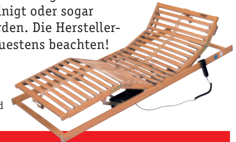
Lattenrost mit Motorverstellung von Kopf- und Fußteil und Härtegradeinstellung

Schonend 1–2 mal jährlich den Staub auf dem Bezugsstoff mit einer sehr weichen Bürste (z.B. Kleiderbürste) abbürsten oder mit einer glatten Polsterdüse – ohne Borsten – vorsichtig absaugen. Die abnehmbaren Bezüge können teilweise chemisch gereinigt oder sogar gewaschen werden. Die Hersteller-Hinweise genauestens beachten!