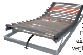
Lattenrost mit Kopf- und Fußteilverstellung, Härtegradeinstellung und Nackenbereich mit verjüngten Federleisten zur besseren Anpassung