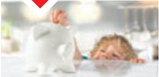
FINANZIERUNG – RATENKAUF