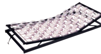
Unterfederung mit Contact-Pads, verstärkte, verbreiterte Auflagefläche zur perfekten Anpassung sowie einzigartige Lüftungsfunktion mit Kopf- und Fußverstellung